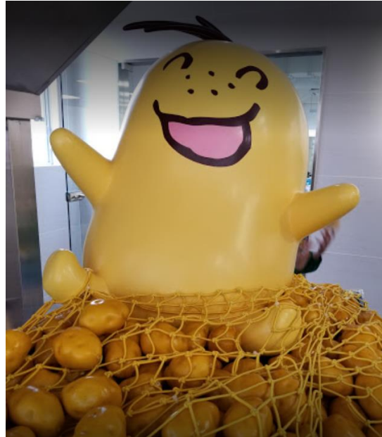
Visit to the Calbee Factory