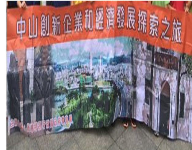
EDB: An Exploration of Innovative Enterprises in Zhongshan