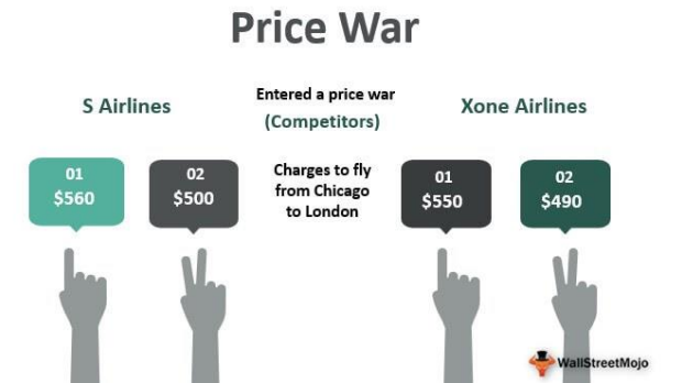
The Hang Seng University of Hong Kong: Price War Game