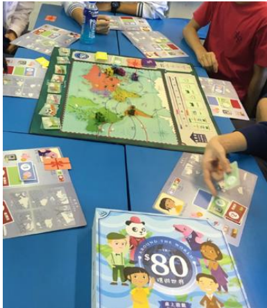
Hong Kong Deposit Protection Board: $80 Around the World Game