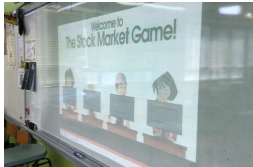
The Boys' & Girls Clubs Association of Hong Kong: 'Saving and Investment Game'