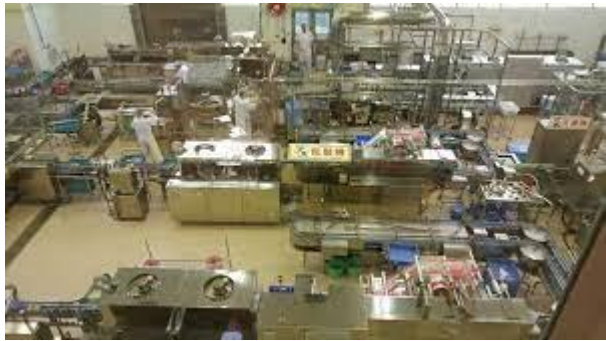
Visit to the Yakult Factory