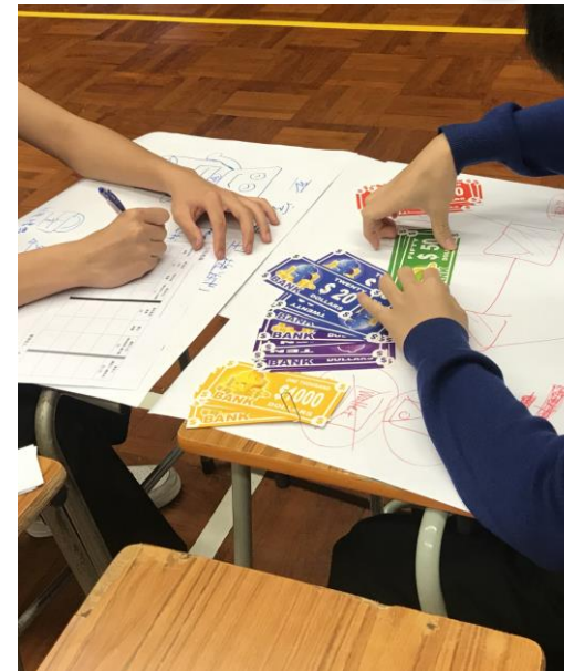
Po Leung Kuk and Citibank: Business Operation and Management Workshop (企業營運工作坊)