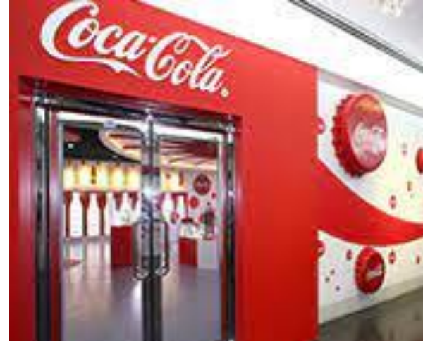
Visit to the Coca-Cola Factory