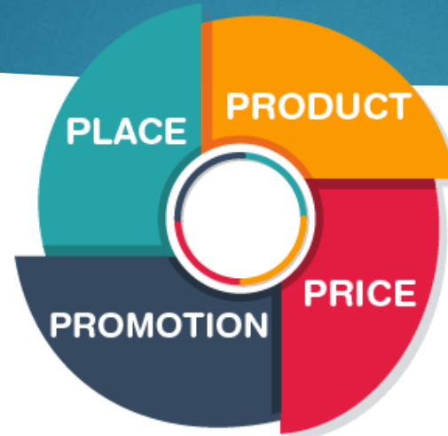
4Ps of Marketing Mix